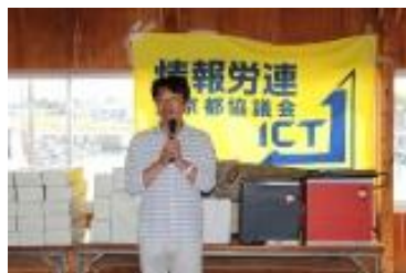
五月女議長あいさつ